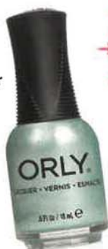
ORLY Ice Breaker