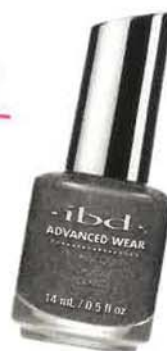
IBD Sleigh All Day